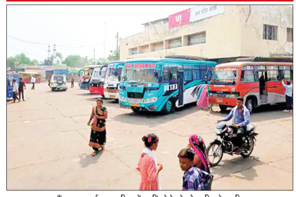
आष्टा। बस स्टैंड पर पर्याप्त यात्री बसें नहीं होने से हो रही परेशानी।

हरिभूमि न्यूज आष्टा शनिवार को शहर के बस स्टैंड पर सुबह से ही यात्रियों की भीड़ तो दिखाई दी लेकिन संचालन होने वाली बसों की संख्या कम रही। इससे यात्रियों को परेशानी का सामना करना पड़ा। बीते एक सप्ताह से शादी समारोह का सीजन चल रहा है। इस वजह से ज्यादातर बसें शादी समारोह में बुकिंग के चलते बस स्टैंड पर नहीं आ रही हैं। इधर, चुनाव आयोग ने कई बसों को वॉटिंग के लिए लिया है। इससे भी डेली चलने वाली बसों की संख्या में कमी आ रही है।